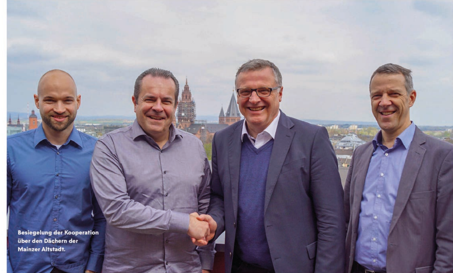
Besiegelung der Kooperation über den Dächern der Mainzer Altstadt.

WIR HABEN SCHNELL FESTGESTELLT, DASS MAINZ 05 EINEN ÄHNLICHEN ANSATZ VERFOLGT. SIE KÜMMERN SICH SEHR UM IHRE NACHWUCHSSPIELER – VOR ALLEM UM DIE, DIE ES NICHT ZUM PROFI SCHAFFEN – SO DASS SIE TROTZDEM EINEN GUTEN EINSTIEG IN IHR BERUFSLEBEN FINDEN.