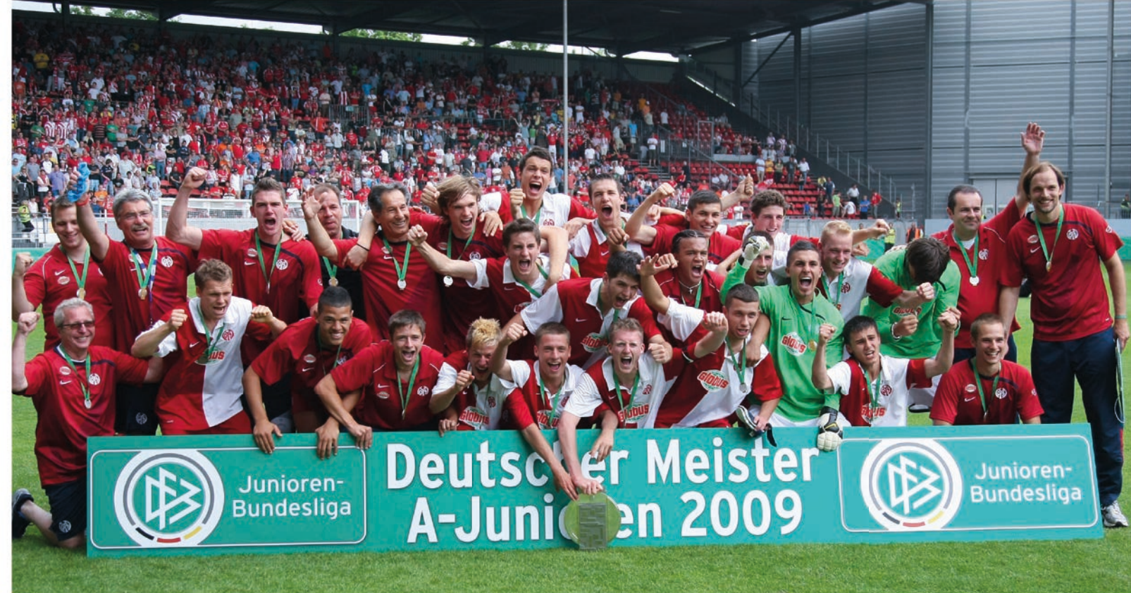
Verdienter Jubel der Meistermannschaft von 2009.

richtige Personalien gesetzt und das Ganze immer weiter von innen heraus, mit viel Leidenschaft in allen Bereichen weiterentwickelt. Wir haben alle mitgenommen auf dem Weg und sind damit zu einem der Top-Nachwuchsleistungszentren in Deutschland geworden", so der NLZ-Leiter.