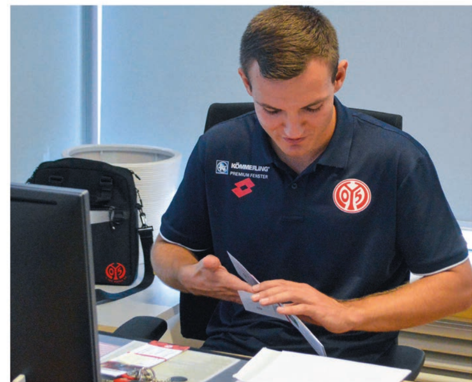
Die Arbeit am Schreibtisch nimmt einen Großteil der Zeit ein.