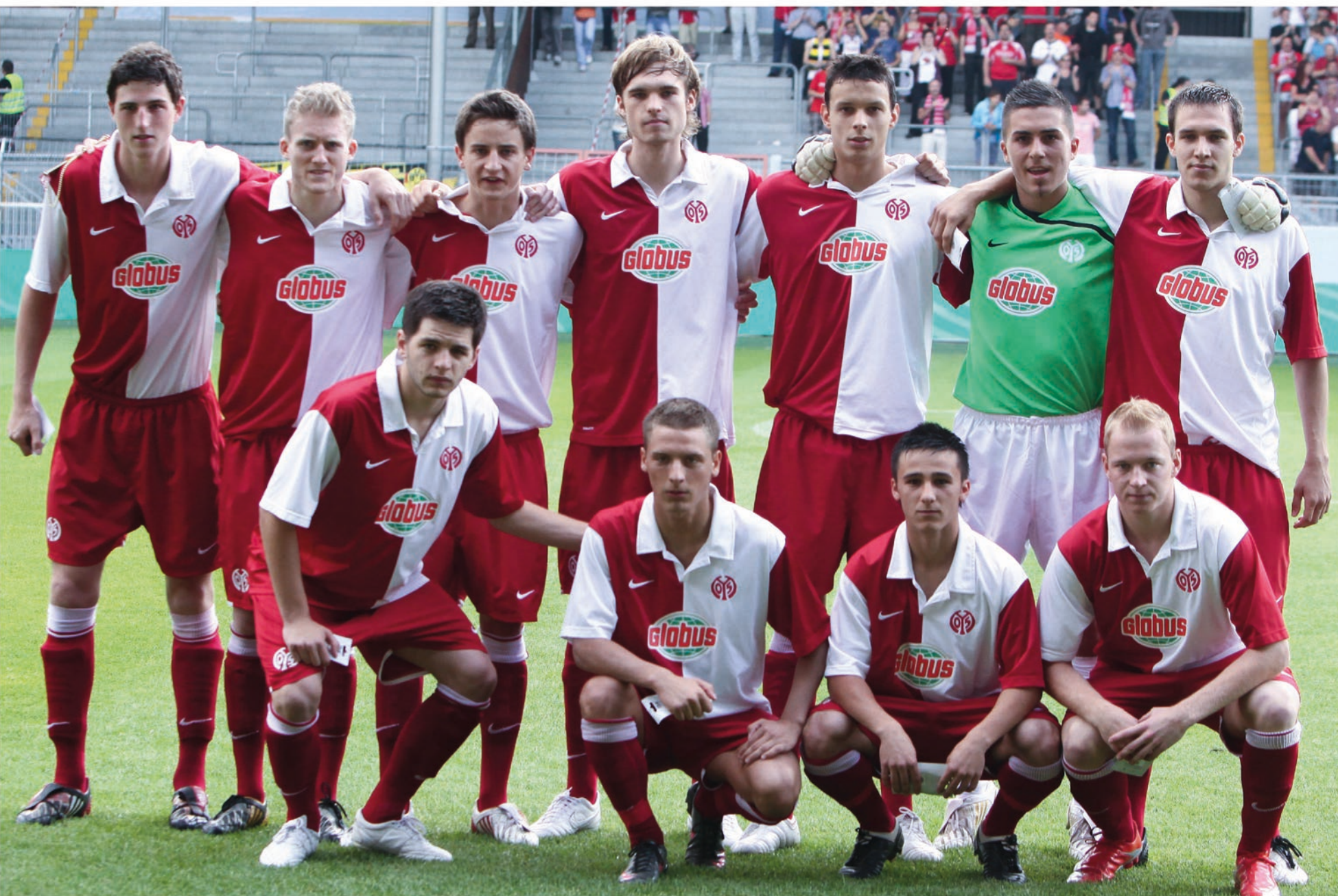
Volle Konzentration vor dem Anpfiff im Bruchwegstadion.