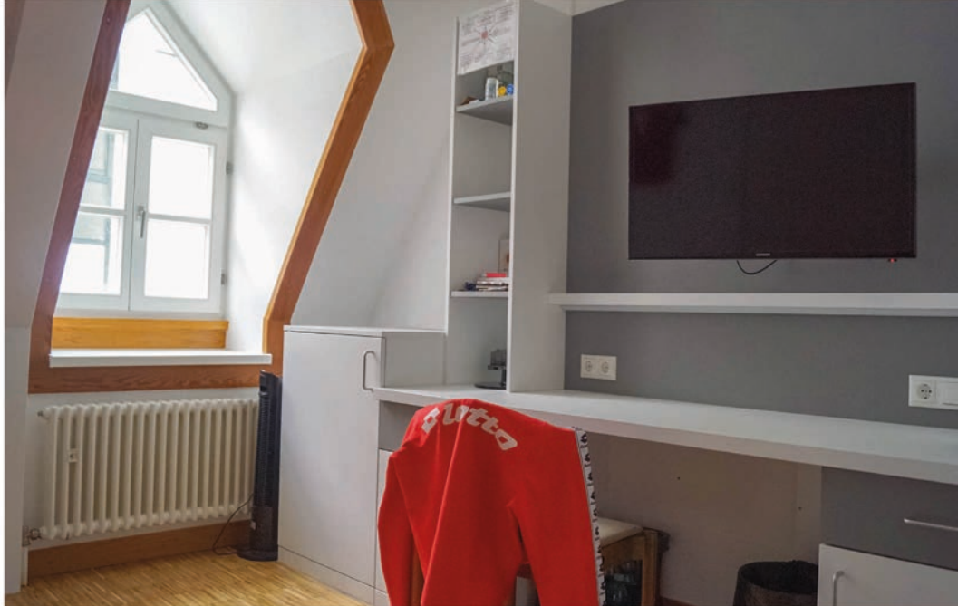
Hier wohnt ein O5ER.