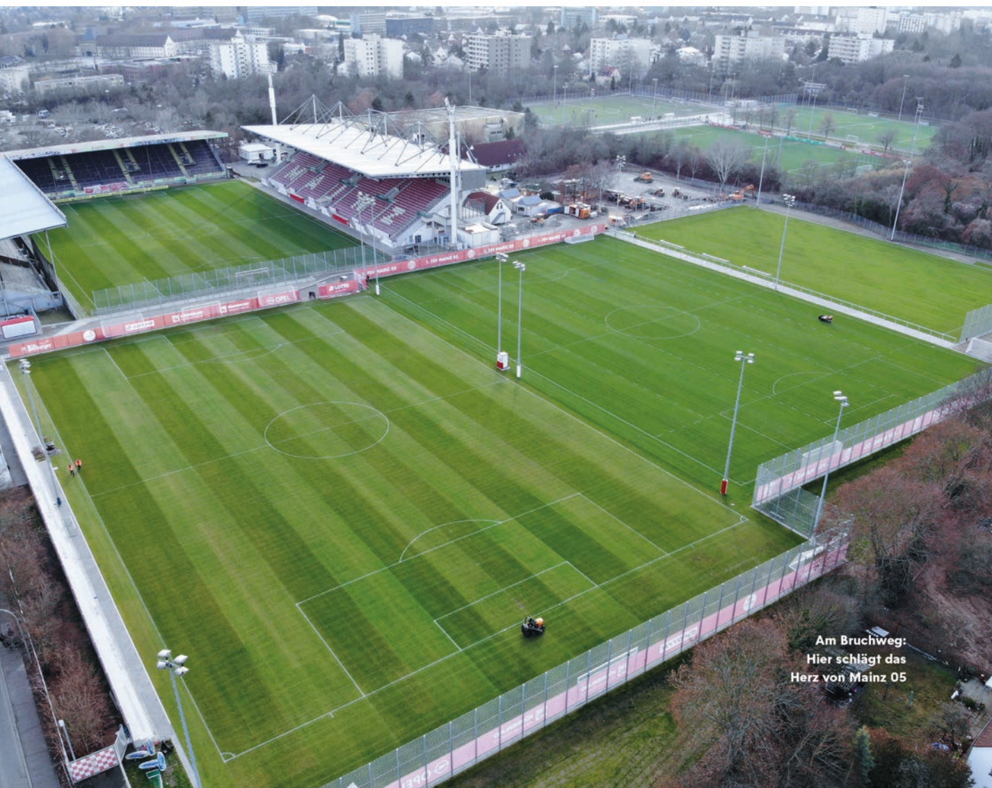
Am Bruchweg: Hier schlägt das Herz von Mainz 05

→ Kersting: Ich wünsche mir, dass wir weitere Spieler in den Profibereich bringen können und natürlich einen möglichst verletzungsfreien und erfolgreichen Saisonverlauf für alle Teams. Von den weiteren Maßnahmen, die wir in Infrastruktur und Personal planen, erhoffe ich mir, dass wir hier schon bald die nächsten Schritte als NLZ gehen können.