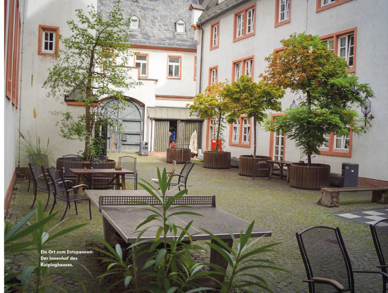
Ein Ort zum Entspannen: Der Innenhof des Kolpinghauses.

Die 05-Juniorenspieler wohnen in Wohngruppen mit eigenen Zimmern, zusammen mit anderen Auszubildenden und Berufsschülern. „Die Jungs sind natürlich viel unterwegs mit ihrem Team und haben eine hohe Belastung. Deshalb möchten sie sich hier vor allem entspannen und regenerieren. Sie können hier abseits des Fußballplatzes